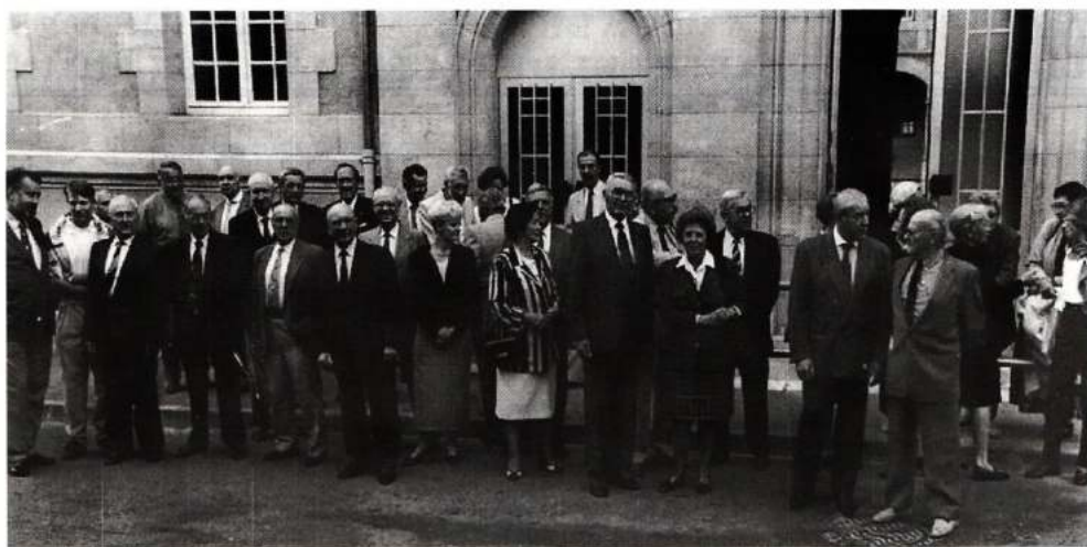
L'heure des retrouvailles devant le Collège.