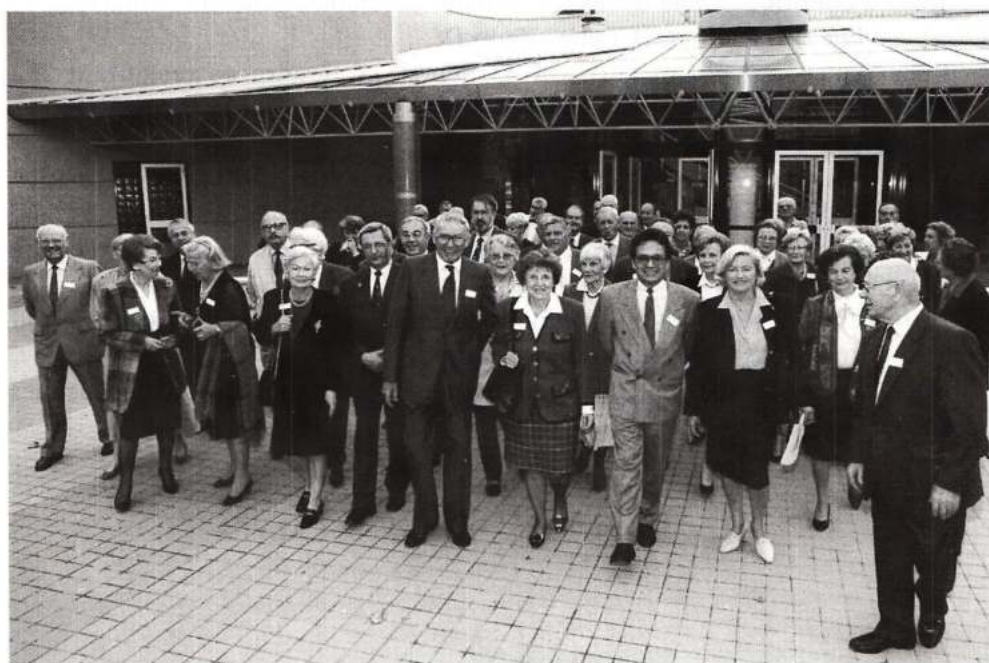
Arrivée des participants à l'Assemblée Générale au Lycée Maine de Biran.